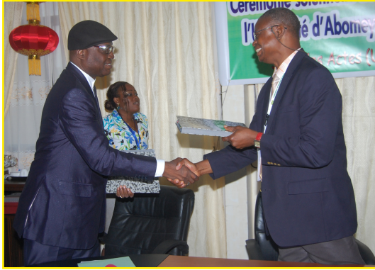
Échange de notes entre le Recteur et le Maire