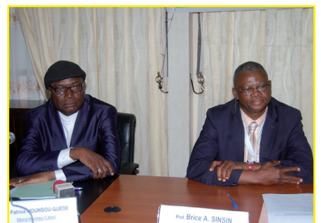
Le Maire d'Abomey-Calavi et le Recteur de l'UAC