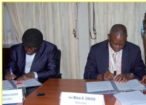
Signature de l'accord-cadre par les deux autorités

En retour, l'UAC bénéficiera des retombées des différentes coopérations décentralisées dans lesquelles la mairie s'engage. Plus précisément, l'UAC bénéficie, dans le plan de parcellisation d'Abomey-Calavi, de quelques hectares