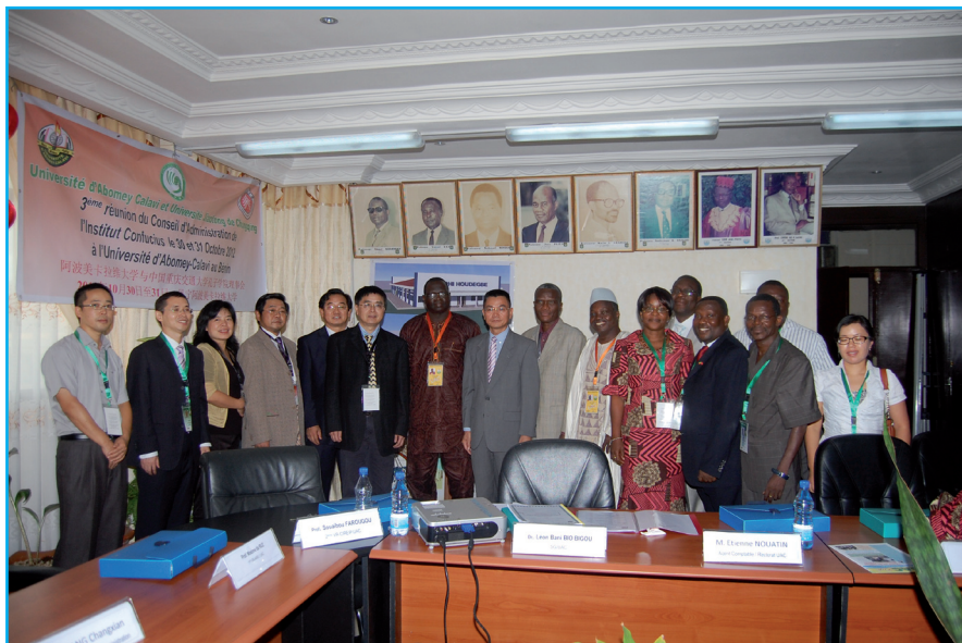
Vue des participants au 3 e CA de l'Institut CONFUCIUS de l'UAC

Après deux réunions du Conseil d'Administration (CA) de l'Institut Confucius en Chine, c'est au tour de l'Université d'Abomey-Calavi d'abriter la troisième édition. Tenue à la Salle des Actes du Rectorat de l'UAC, cette troisième session du Conseil d'Administration a réuni l'ensemble des conseillers venus, pour partie, de la Chine et pour l'autre, du Bénin. Ainsi on pouvait noter, la présence d'une délégation de l'Université chinoise Jiaotong de Chongqing, du Directeur du Centre Culturel Chinois de Cotonou, du Directeur et du Directeur Adjoint de l'Institut Confucius, de la Directrice du Centre des Œuvres Universitaires et Sociales (COUS) et de responsables de l'UAC.